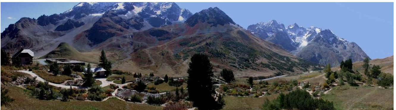
Le Jardin Botanique Alpin du Lautaret (2100 m)