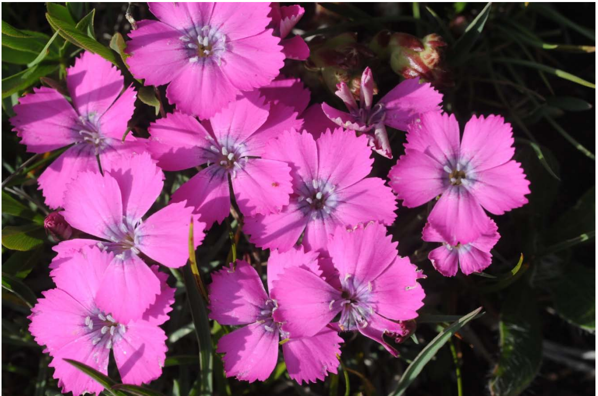
Dianthus pavonius Tausch (Col du Lautaret, 2100 m)